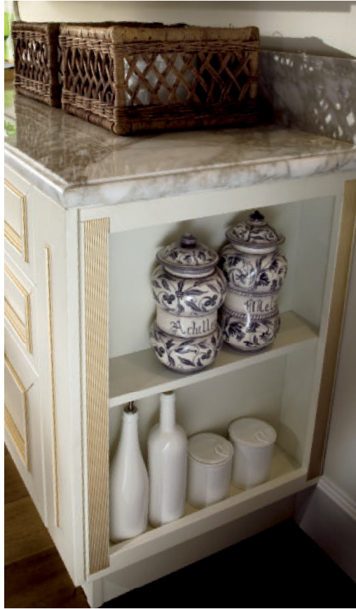
En las páginas precedentes y en la página de la derecha, visión de conjunto de Romantica Décor, color blanco mantequilla. Encima, a la izquierda, detalle del gran colgante abierto con puerta corredera revestida con pan de oro y el bajo terminal con espacios abiertos enriquecidos con una cornisa dorada.

Previous pages and page on the right, views of the butter-white version of Romantica Décor. Above left, detail of the large open-fronted wall unit with its sliding doors lined with gold flake and the shelved end base unit embellished by a gold cornice.