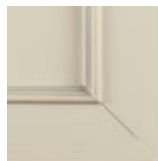
Bianco Burro/Argento Butter white/Silver blanco mantequilla/plateado Кремовый/Серебряный профиль