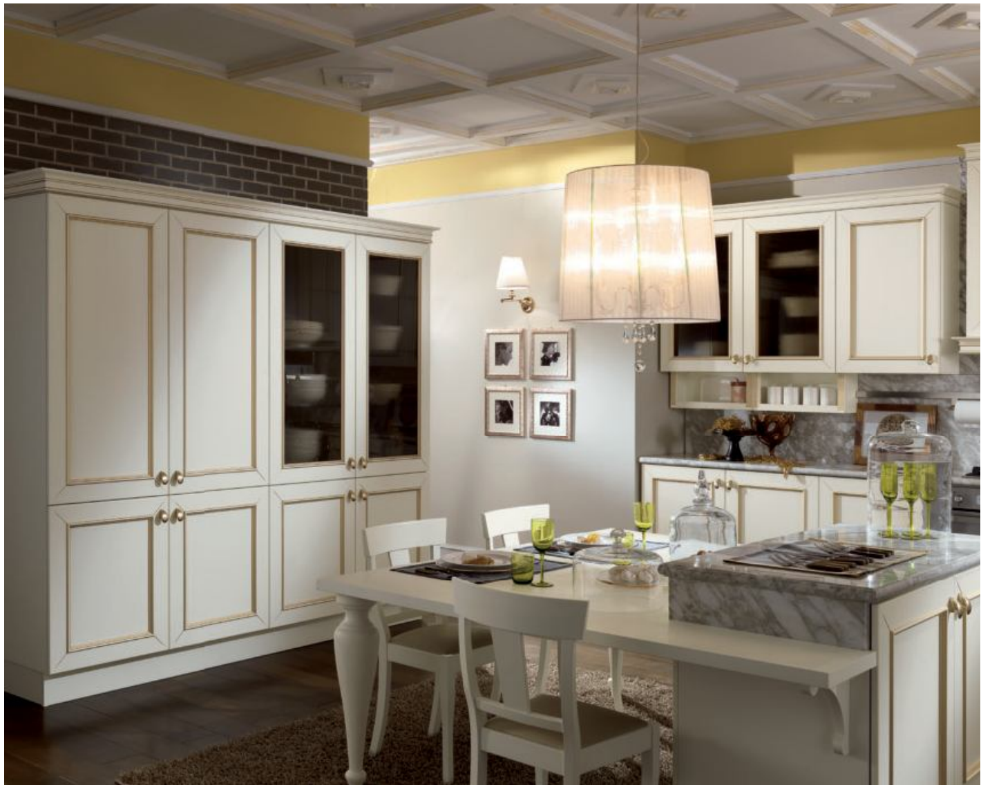
A la izquierda, detalle de los bajo colgantes con cornisa divisora dorada. A la derecha, el gran armario con, en primer plano, la isla snack de mármol calacatta.

Left, detail of the under wall units with gilded partition moulding. Right, the large tall unit with, in the foreground, the snack island in Calacatta marble.