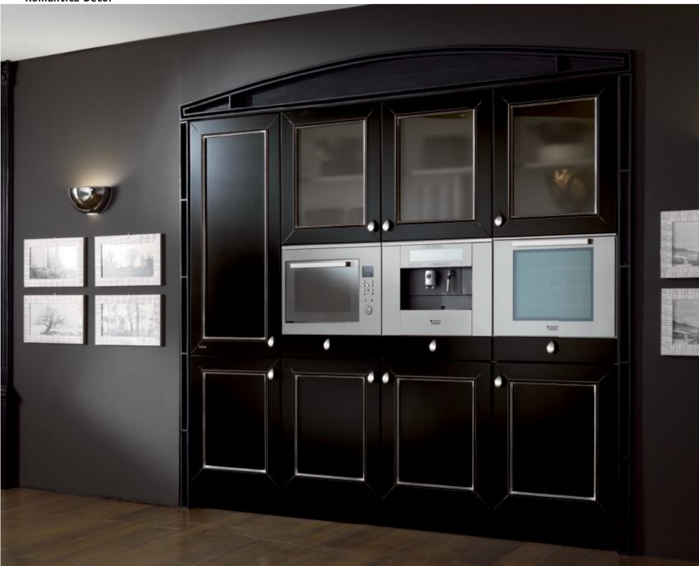
L'armadiatura con elettrodomestici di ultima generazione: forno a microonde, macchina per il caffè, forno elettrico.