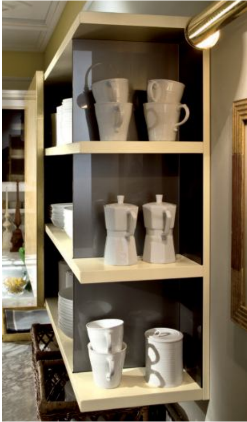
Nelle pagine precedenti e nella pagina a destra, visioni di insieme di Romantica Décor versione bianco burro. Sopra, a sinistra, particolare del grande pensile a giorno con anta scorrevole rivestita in foglia d'oro e il terminale base con spazi a giorno impreziositi da una cornice dorata.

Previous pages and page on the right, views of the butter-white version of Romantica Décor. Above left, detail of the large open-fronted wall unit with its sliding doors lined with gold flake and the shelved end base unit embellished by a gold cornice.