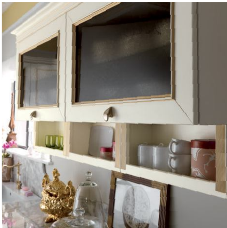
L'anta della vetrina basculante in vetro satinato, con cornice interna filettata in oro. A destra, parete con pensili chiusi e a vetrina, con area di lavoro. Top in marmo calacatta e grandi forni in finitura ghisa.

The lift-up door of the glass wall unit in satin finish glass with internal cornice filleted in gold. Right, wall with closed and glass fronted wall units with work area. Top in Calacatta marble and large forms in a cast iron finish.