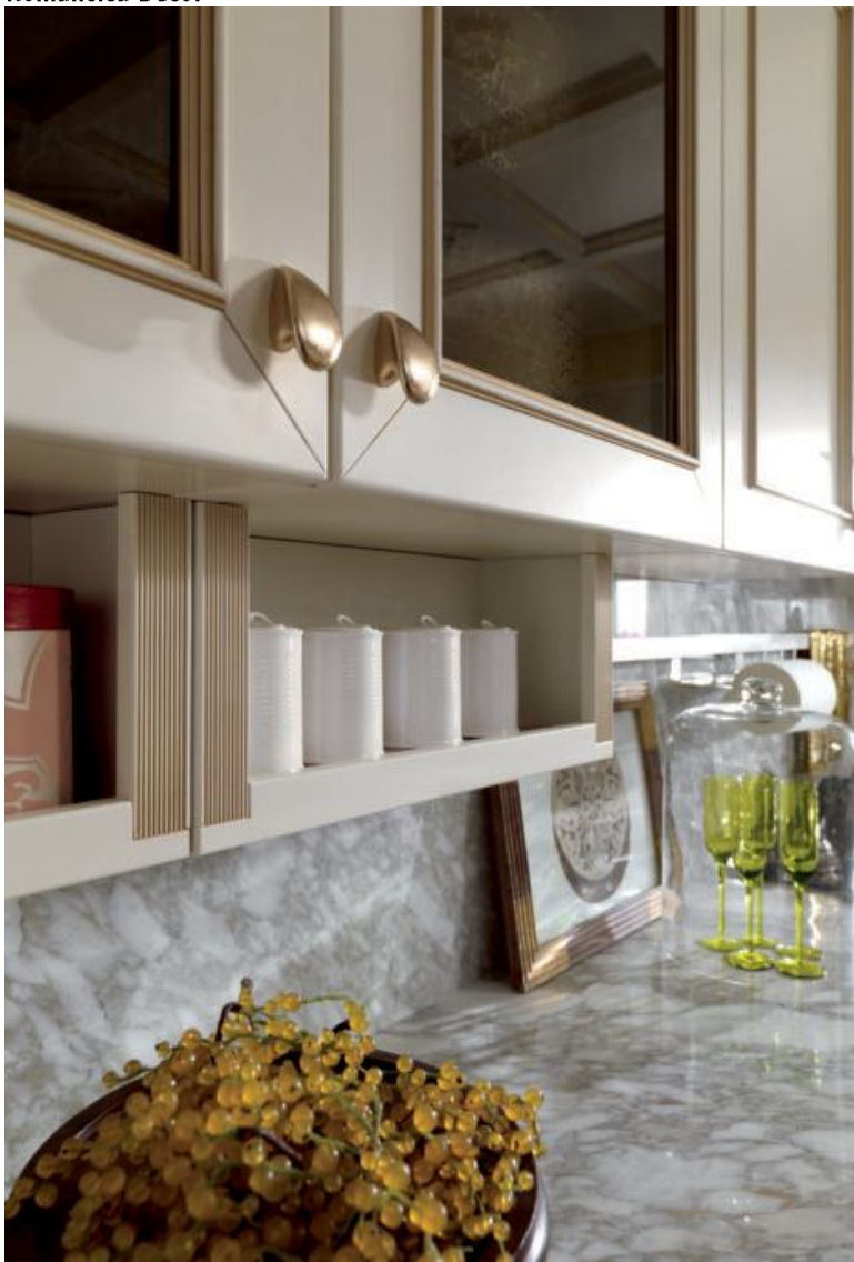
A sinistra, particolare dei sottopensili con cornice divisoria dorata. A destra, la grande armadiatura con, in primo piano, l'isola snack in marmo calacatta.

Left, detail of the under wall units with gilded partition moulding. Right, the large tall unit with, in the foreground, the snack island in Calacatta marble.