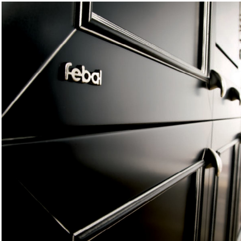
Sopra, il gioco dei profili e delle cornici argentate. Nella pagina a destra, il tavolo con sedie dall'elegante schienale arcuato e le gambe rastremate e incurvate di disegno classico.

Above, the interplay of profiles and silvered cornices. Page on the right, the table with elegant arched-back chairs and tapered curved classic style legs.