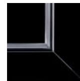
Nero/Argento Black/Silver negro/plateado Черный/Серебряный профиль