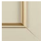
Bianco Burro/Oro Butter white/Gold blanco mantequilla/dorado Кремовый/Золотой профиль