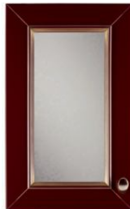
Vetrina Glass door Puerta vitrina Застекленная створка